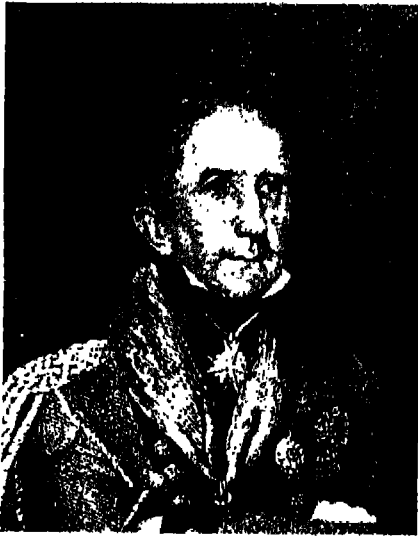
السير هدوسون لو، الحاكم البريطاني لجزيرة سانت هيلين.